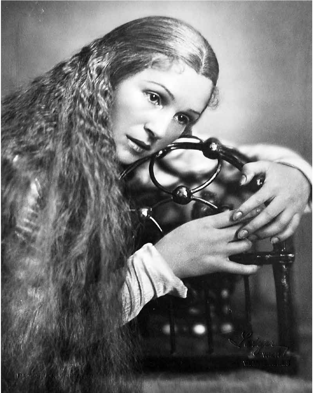
Dunaj / Vienna / Wien