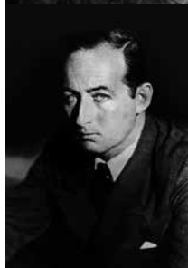
ERNST R. STARHEMBERG