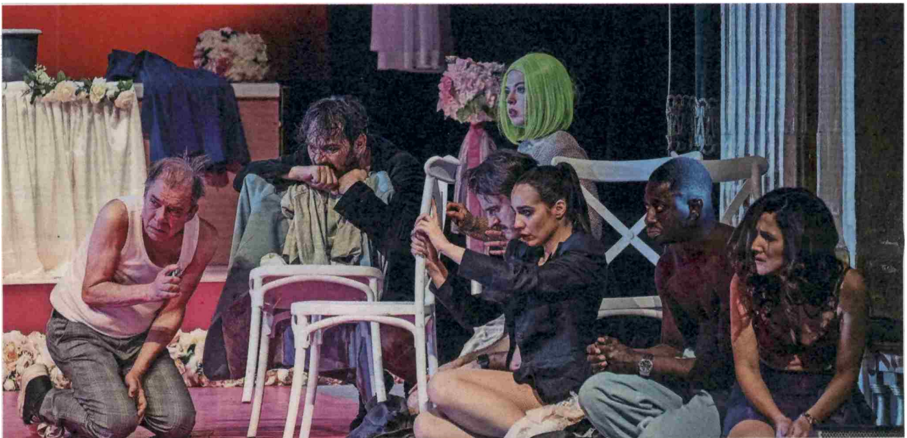
Najboljša evropska predstava je hkrati zabaven in resen pregled nekaterih vprašanj našega časa.