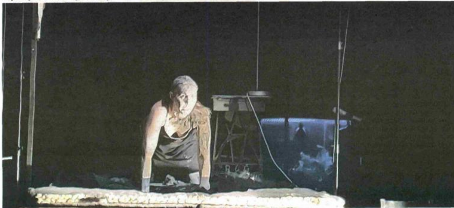
"Avgust" na festivalskoj pozornici "Zlatnog lava"

Prve festivalske večeri se umaškoj publici predstavilo Slovensko narodno gledalište Nova Gorica u koprodukciji s Teatrom na konfini s predstavom "Avgust" (August) u režiji Mihe Nemeča