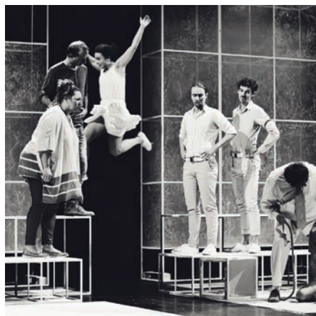
ASTRID LINDGREN RONJA, RAZBOJNIŠKA HČI

DOROTEJO, KI ŽIVI S TETO IN STRICEM, TORNADO ODNESI V DEŽELO OZ. TO JE SICER OČARLJIVA DEŽELA, A DEKLICA SE KLJUB TEMU HOČE VRNITI DOMOV. VRNE PA SE LAHKO LE, ČE GRE NAJPREJ DO ČAROVNIKA OZA. NA POTI SE JI PRIDRUŽIJO STRAŠILO BREZ PAMETI, PLOČEVINASTI ČLOVEK BREZ SRCA IN LEV BREZ POGUMA. PREDSTAVA O ODRASČANJU, POGUMU IN ZAUPANJU VASE VSEBUJE VELIKO PETJA IN PLESA, ZATO SMO JO POIMENOVALI PRAVLJIČNI MUZIKAL. MALI ALI VELIKI ODER. PREDSTAVA TRAJA 1 URO IN 20 MINUT.