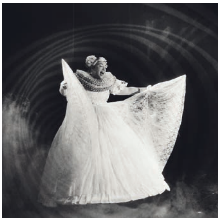
LYMAN FRANK BAUM ČAROVNIK IZ OZA